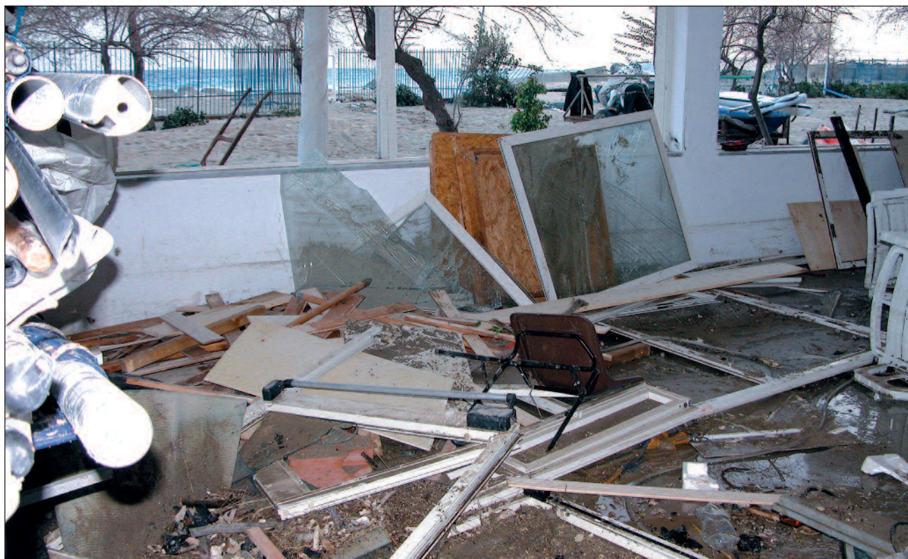
Ancora una volta le forze della natura di questo splendido ma incontrollabile angolo di Mediterraneo tornano ad accanirsi contro la Sezione, come dimostra questa immagine del salone ripresa dopo la mareggiata del 2004

miseramente nel porto di Bari. In un'intervista del 1982, l'allora ottantatreenne comandante Geraci, rammaricato, sottolineò: “Dopo l'impresa e l'esposizione in fiera, tentai di tutto, ma inutilmente, per fare ricoverare la goletta in un museo navale. Se la MAS fosse stata conservata, oggi rappresenterebbe un cimelio di grande valore” . E lo sarebbe ancora di più ora, a distanza di altri trent'anni.