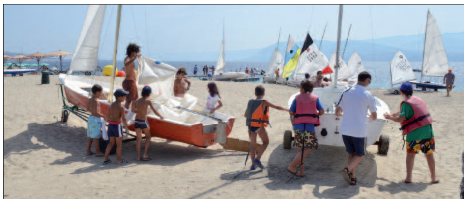
E, alla fine, dopo la teoria arriva il momento che tutti gli studenti attendono: quello della pratica

Recupero, per far fede al suo nome, comincia a .... recuperare vecchi soci che si erano allontanati e a ricostituire il parco imbarcazioni che non esisteva più; a poco a poco, in virtù della sua intraprendenza, ben coadiuvato da un gruppo dirigente appassionato e competente, comincia a portare nuovi soci e, con essi, nuova linfa, incrementando le attività ricreative, culturali e quelle sportive; viene ristrutturata la sede sociale, dotandola di ulteriori servizi tra i quali uno specchio acqueo con un campo boe ed un pontile galleggiante, utilissimo per le attività dei nuovi gruppi sportivi vela e pesca.