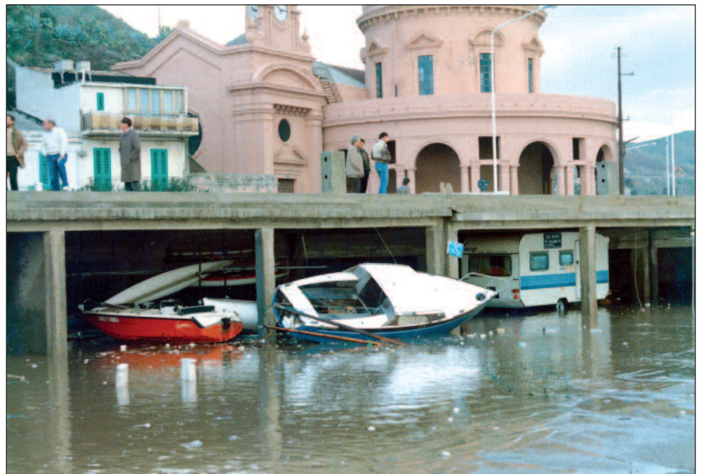
I disastrosi effetti che ebbe sulle strutture della Sezione la mareggiata che, nel 1987, devastò tanta parte della Sicilia

Successivamente, nel 1936, la MAS venne esposta alla Fiera del Levante per poi morire lentamente e