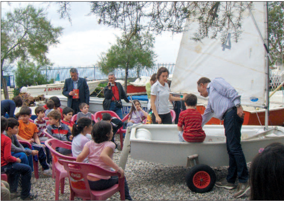
Un momento della vita quotidiana della Sezione: la lezione di teoria al corso di vela per principianti...